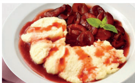
Hausgemachter Vollmilch-Grießbrei mit Pflaumenkompott (mit Süßungsmitteln und einer Zuckerart)

Weitere Informationen zu unseren Weihnachts- Menüs finden Sie auf der Rückseite.