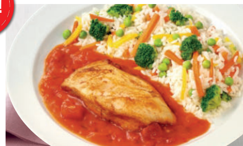
Hähnchenbrust in fruchtiger Tomaten-Balsamico-Soße, dazu Gemüsereis