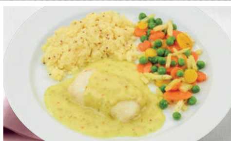
Kap-Seehecht in feiner Honig-Senfsoße mit Frühlingsgemüse, dazu Kartoffel-Senf-Stampf